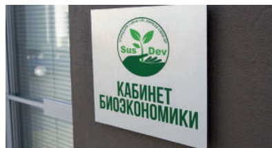
Кабинет биозкономики (ЗКАТУ)