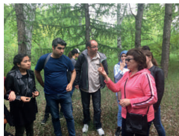
Международная летняя школа (КАТУ)