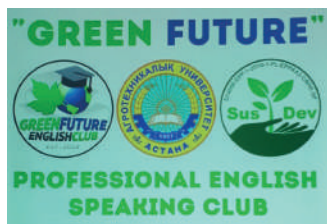
Клуб профессионального разговорного английского языка (КАТУ)