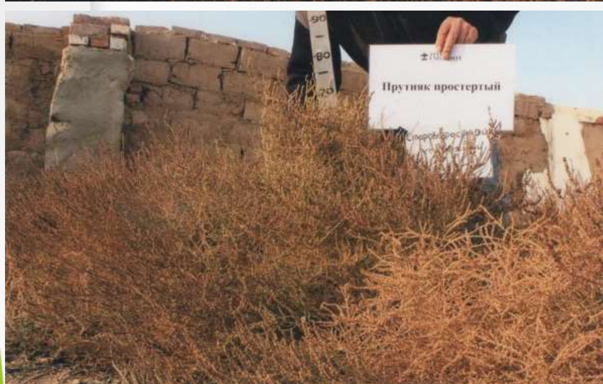
Рисунок 6 Высота растений прутняка девятого года жизни (70 см). Урожайность плодофуражной продукции 59,0 ц/га.