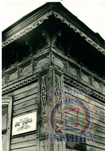
История одного дома