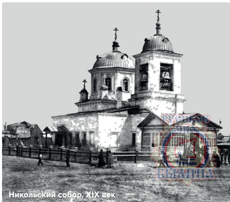
Никольский собор, XIX век

Лев ГУЗИКОВ